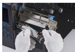
Cabeça de impressão