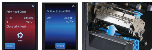
Alerta de erros